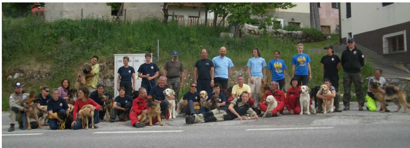
Alcuni dei partecipanti al Corso estivo in Folgaria